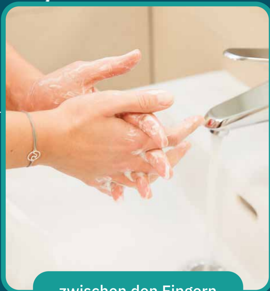
zwischen den Fingern