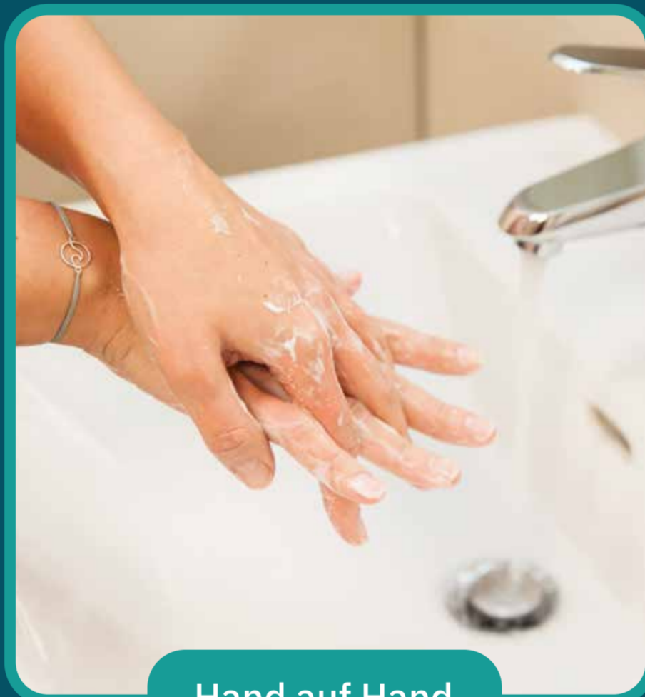
Hand auf Hand