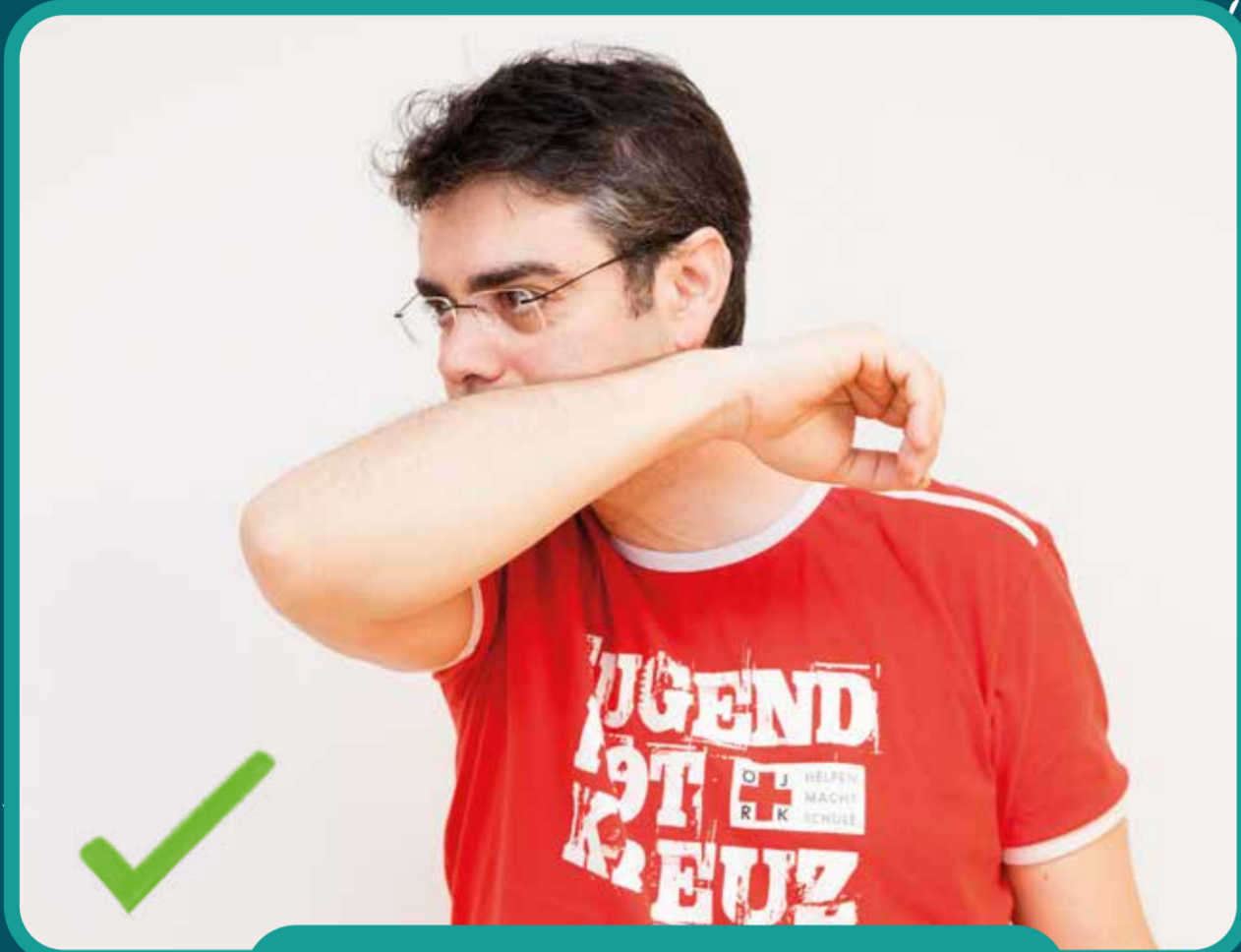
in Armbeuge husten/niesen